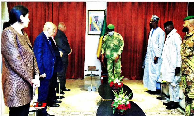
الحاكم العسكري في مالي مستقبلا وفدا بوليساريو وأمنيا جزائريا (خاص)

ربطها بشبكات النقل والتواصل محيطها الإقليمي، والمغرب مستعد لوضع بنياته التحتية، الطرقية والمينائية والسكك الحديدية، رهن إشارة هذه الدول الشقيقة، إيماناً منا بأن هذه المبادرة ستشكل تحولا جوهريا في اقتصادها، وفي المنطقة كلها... يؤكد الملك محمد السادس.