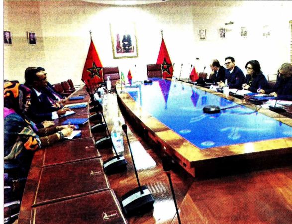
جلسة مباحثات بين الربوروش والسفير الموريتاني (خاص)